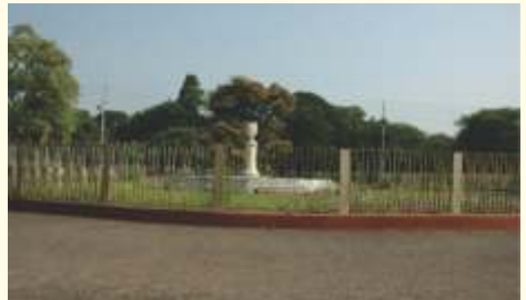
The Kyd's Monument at AJCIBIG, Howrah