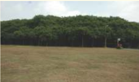
The Great Banyan Tree of AJCIBIG, Howrah